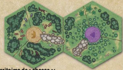
2 territoires de « chasse » : Ours (à gauche) et baies (à droite) v isin chacun de 3 régions

Chaque tuile consiste en deux territoires de chasse, chacun entouré de trois régions. Un clan ne peut chasser un certain type de nourriture que s'il dispose d'au moins un membre établi dans une région joux tant un territoire de chasse correspondant, ainsi que d'un ou plusieurs outils correspondant (cf plus bas). S'il y a plusieurs territoires de chasse identiques, l'approvisionnement de la nourriture correspondante augmente (cf page 7, Bureaucratie), ainsi que l'efficacité des outils, si le clan est établi à côté de plusieurs de ces territoires (voire phase Chasse).