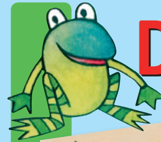
イラスト: Barbara Kinzebach