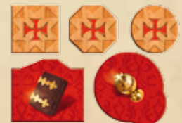
Les objets d'un joueur avec la face comptabilisée visible.