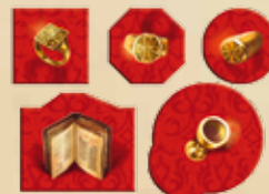
Les objets d'un joueur avec la face non comptabilisée visible.

Note : dans une partie à 3, les joueurs devraient accepter de jouer sans Stephanus, l'Enlumineur pour corser le jeu. À 4, ils en ont la possibilité, mais ce n'est pas obligatoire. Dans ce cas, chaque joueur reçoit 9 cartes au lieu de 10.