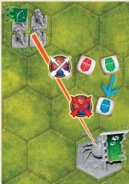
Les flèches des archers manquent leur cibles

Une unité qui élimine une Créature gagne un pion arcane pris dans la réserve commune pour récompenser son acte héroïque. Placez ce pion dans l'hexagone de l'unité qui a accompli cet acte de bravoure. Si l'unité se déplace, le pion suit l'unité.