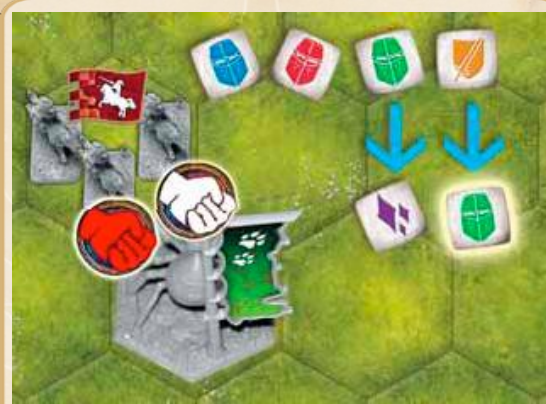
Mais les lourdes épées de la cavalerie l'élimine

L'unité peut dépenser ce pion arcane et le remettre dans la réserve commune de la façon suivante :