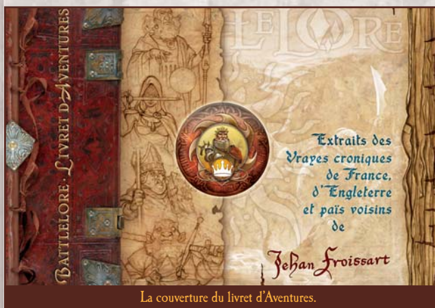
La couverture du livret d'Aventures.