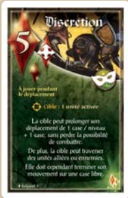
Discretion du Brigand