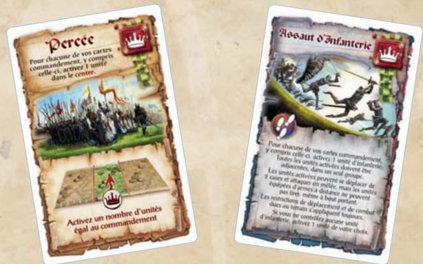
Carte Zone — Carte Tactique

La partie se déroule en une série de tours de jeu, les joueurs jouant chacun leur tour. Pendant son tour, un joueur active les unités qu'il contrôle et déclenche leur Déplacement et leur Combat en jouant une carte Commandement et en appliquant ses effets.