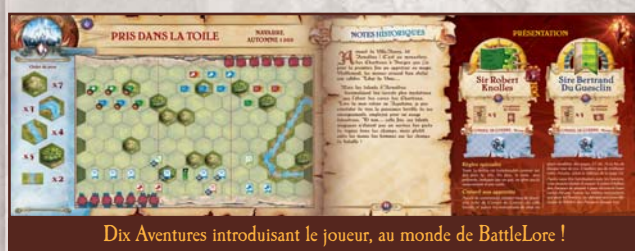
Dix Aventures introduisant le joueur, au monde de BattleLore !

• Un livret d'Aventures de 24 pages, Les Vraies Croniques de Jean Froissart . Ce livret vous offrira un survol de l'Uchronie médiévale de BattleLore du point de vue d'un de ses plus grands chroniqueurs, et vous guidera dans une série de 10 aventures, avec une initiation progressives aux mécanismes de jeu.