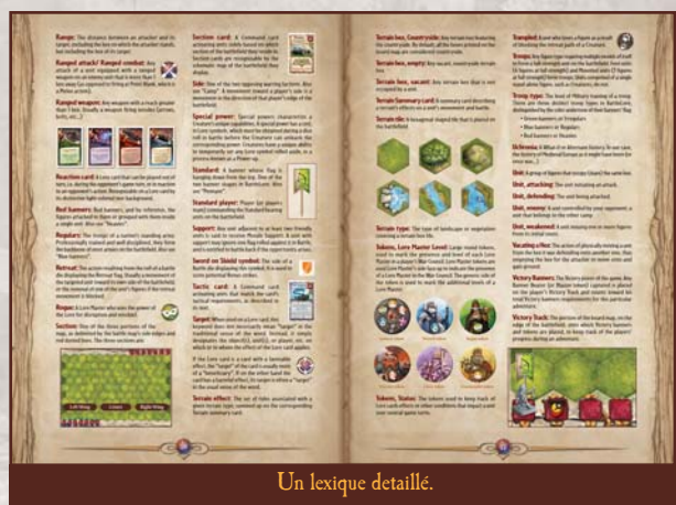
Un lexique détaillé.