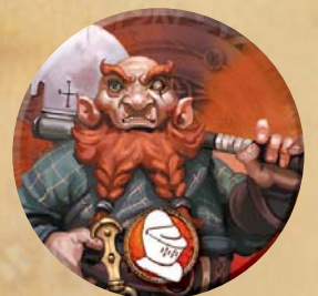
Pion du Guerrier