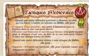
Deux résumés essentiels des concepts tactiques.