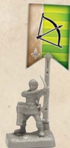
Archers à Bannière verte.