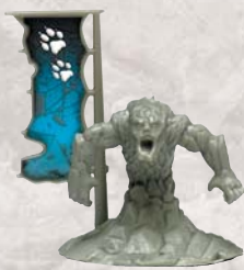
Élémentaire de terre

Le Géant des collines et l'Élémentaire de terre sont deux créatures réservées* aux premiers acheteurs en Europe. Elles seront distribuées en nombre limité aux boutiques de jeux participant à l'opération, ou sur notre site Internet. La sortie officielle du jeu est prévue pour fin Novembre 2006.