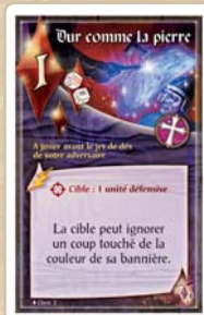
Dur comme la pierre du Clerc

L'Arcane est le bien le plus précieux des Maîtres des Arcanes. Ces piens permettent effectivement d'alimenter les actions légendaires de ces vétérans, en payant le coût des très impressionnantes cartes Arcane .