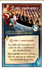
Toile enchantée du Sorcier