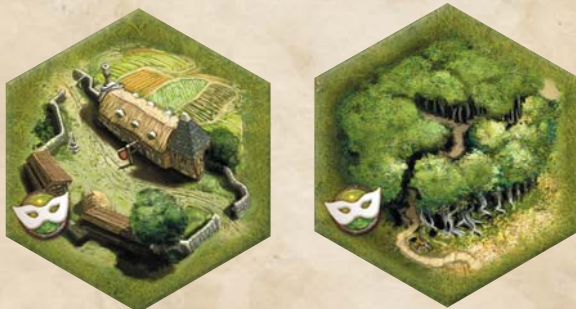
Un célèbre repaire de brigand, avec son passage secret qui débouche loin à l'arrière du Flanc droit de l'ennemi.

Le plateau de jeu, ainsi que les éléments de Terrain ou de Lieux remarquables qui sont placés dessus, décrivent le champ de bataille sur laquelle les combats se déroulent.