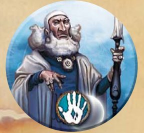
Pion du Sorcier