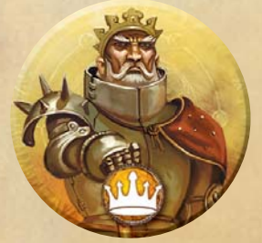
Pion du Commandant