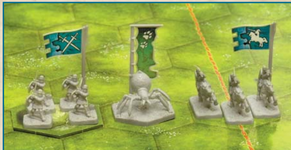
Une unité d'infanterie, une Araignée géante et une unité de cavalerie en chemin vers le front.

Une Aventure décrit le Champ de bataille sur lequel chaque joueur s'efforce de mener ses troupes à la victoire. Ces armées sont représentées par divers groupes de figurines, rassemblées sur une même case hexagonale de terrain pour former une Unité .