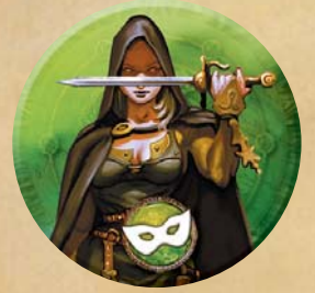
Pion du Brigand