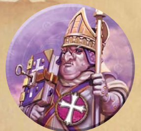
Pion du Clerc