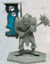
Géant des collines

Cet hiver, soyez prêt à redécouvrir un univers fantastique que vous pensiez disparu depuis longtemps, et retrouvez le plaisir des aventures épiques de votre jeunesse dans un nouveau format, familier et intuitif, mais aussi plus adapté à votre vie actuelle.