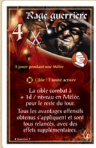
Rage guerriere du Guerrier