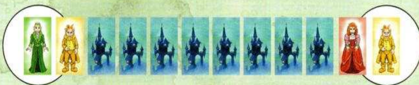
Fig. 1: At the beginning of the game, each player turns over 2 vampires at each end (left and right) of his card row. Only the outermost vampires (within the white circle) are compared to the grave lid colour. In this example, you have to find either a green or a yellow grave lid in order to put one of your vampires to rest.

Il est possible que la couleur des deux vampires qui se trouvent aux extrémités de ta rangée corresponde à celle du couvercle. Dans ce cas-là, choisis-en un pour le placer dans le caveau. L'autre reste à sa place.