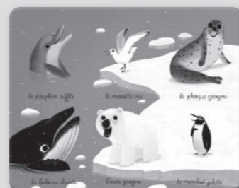
Planche bleue : l'océan et la banquise