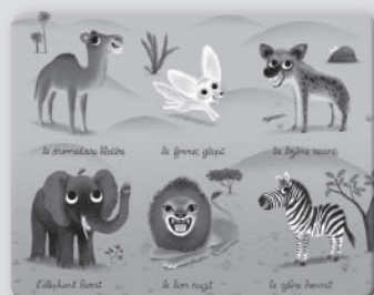
Planche jaune : la savane et le désert