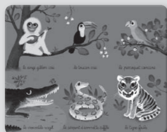
Planche vert foncé : la jungle