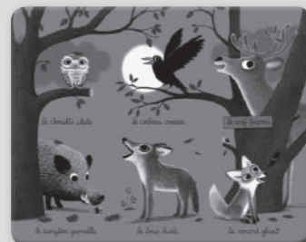
Planche orange : la forêt