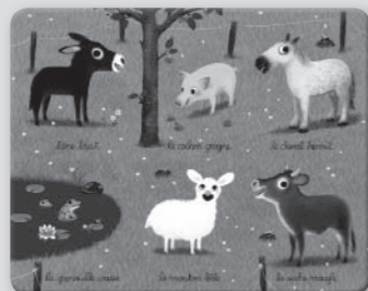
Planche vert clair : la prairie