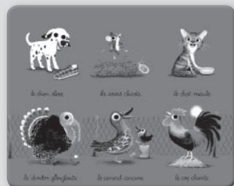
Planche rouge : la ferme

Le jeu comporte un CD, 36 jetons et 6 planches de jeu :