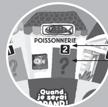
numéro de la maison

le joueur a déjà le jeton « poisson » : il va sur la case « défi » de la poissonnerie et répond à la question « poissonnier » de la carte « défis ». Il peut alors mettre le jeton « poisson » face visible, dans les mains du poissonnier.