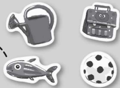
jetons « accessoires »