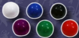
6 SPHÈRES DE SCORE