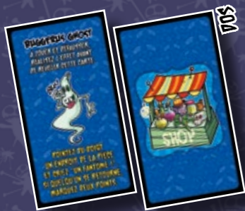
13 CARTES ARTEFACT