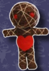
UNE POUPÉE VODOO