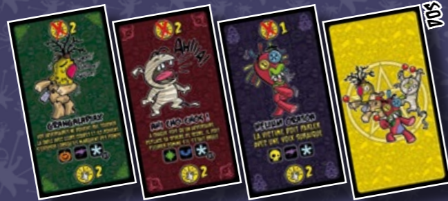
36 CARTES MALÉDICTION 12 CELTES, 12 ÉGYPTIENNES, 12 HAÏTIENNES