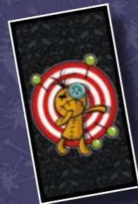
UNE CARTE CIBLE