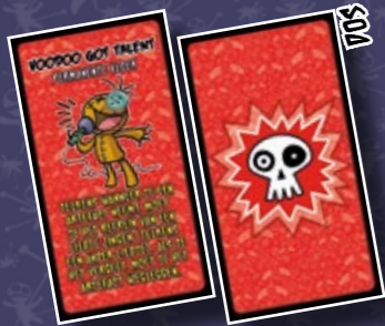
10 CARTES MALÉDICTION PERMANENTE