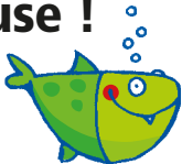
Illustration : Ulrike Fischer

Petits et grands pêcheurs se retrouvent autour de l'étang pour l'annuel concours de pêche. Pierrot le pêcheur est aussi venu jeter sa canne à pêche à l'eau. Soudain, un carré de poisson vert apparaît et lui dit : « Pêche-moi ! ». Ebahi, Pierrot se frotte les yeux. Et voilà qu'un deuxième carré de poisson et une boulette de poisson rouge nagent vers lui. Et tous lui disent en chœur : « Pêche-moi ! ».