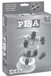
Pisa Reiseditie 12679