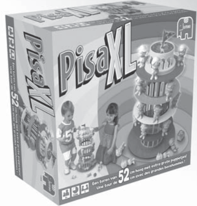
Pisa XL 17646

Kijk voor een compleet overzicht van alle Jumbo spellen en verkoopadressen op: www.jumbo.eu