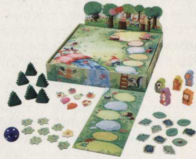
paysage de jeu

Avant de jouer pour la première fois, appuyez sur les plaquettes pour les détacher de la plaque. N. B. : jetez les morceaux restants aussitôt pour éviter qu'ils ne soient avalés par les enfants.