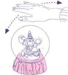
Figure 3. Passe ta main 2 fois au-dessus de Zandar pour l'entendre parler.

1. Distribue une carte "Zandar pourrait se tromper - REPOSE TA QUESTION !" à chaque joueur. Chaque joueur place sa carte face visible devant lui. (Les cartes restantes "REPOSE TA QUESTION" sont retirées du jeu).