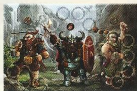
Tapis « nains »