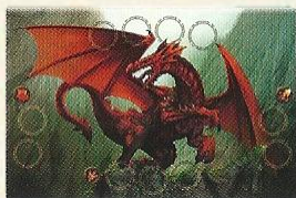
Tapis « dragon »